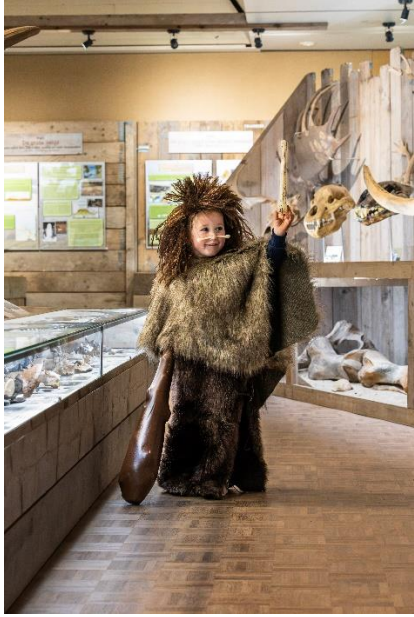
Verkleed als een Neanderthaler